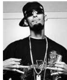
Hamdoullah sa va :

Pour visionner un extrait de La Fouine cliquer sur le lien ci-dessous